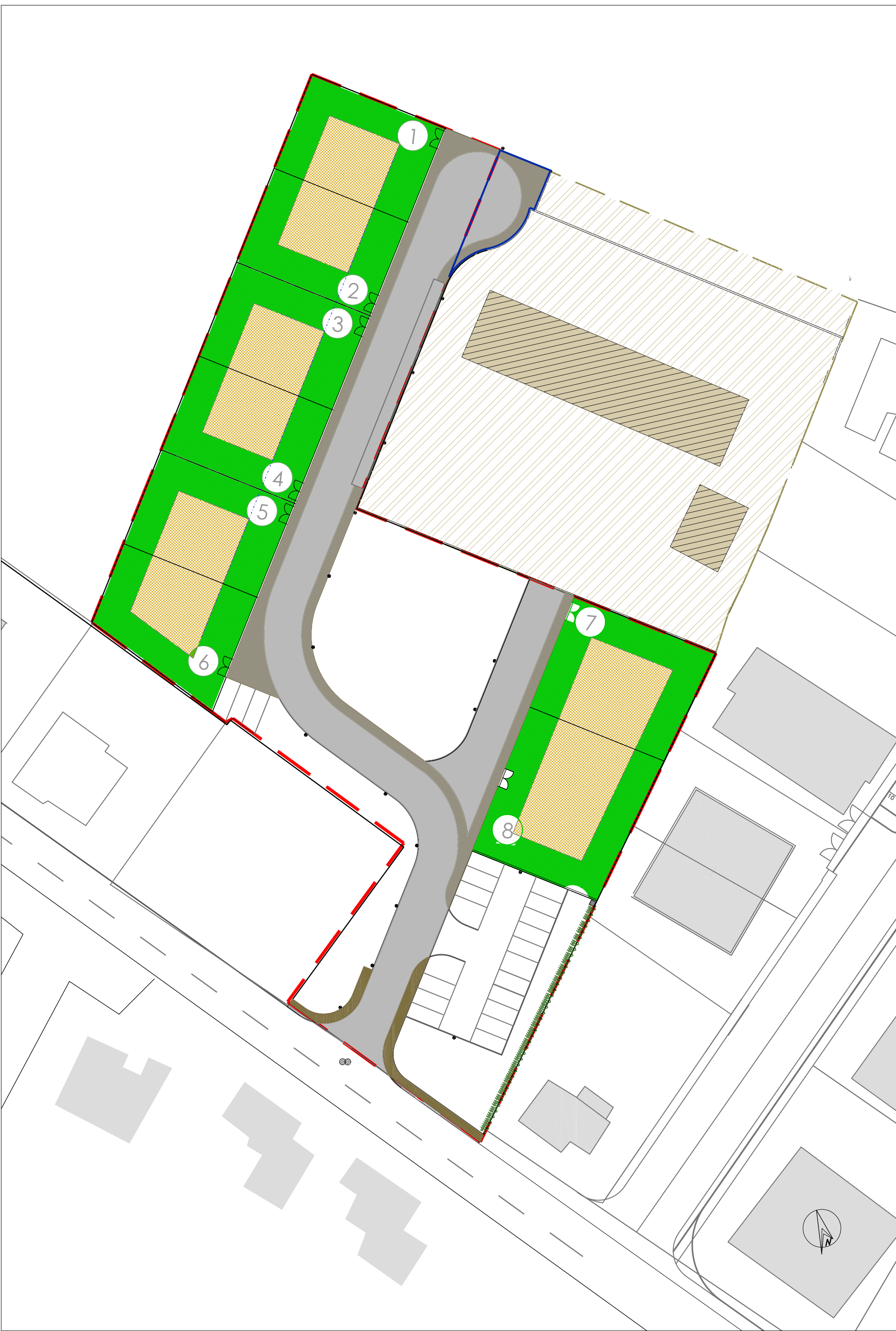
PLANIMETRIA DI PROGETTO AREE PUBBLICHE ZONIZZATE E PRIVATE