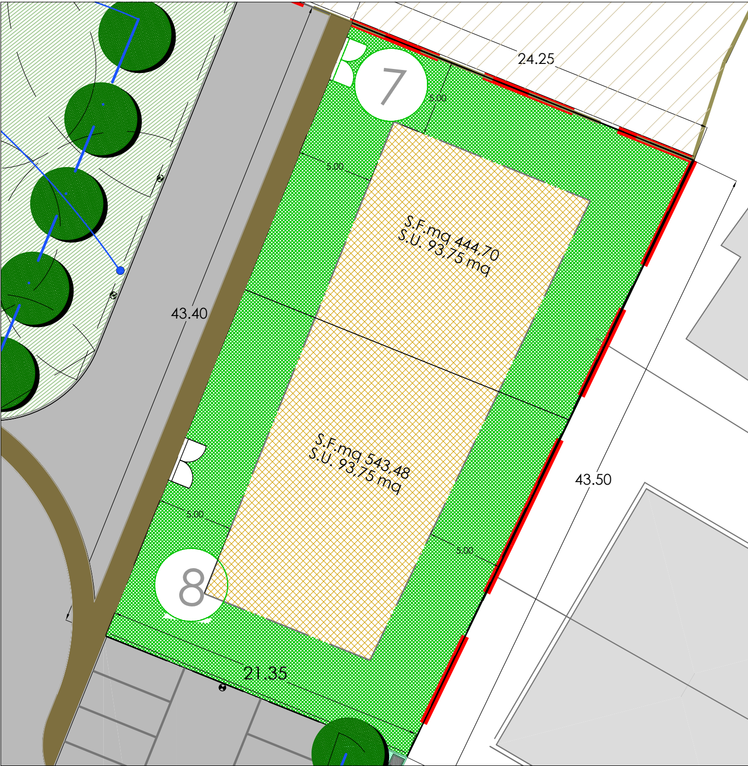
PLANIMETRIA LOTTI 7-8