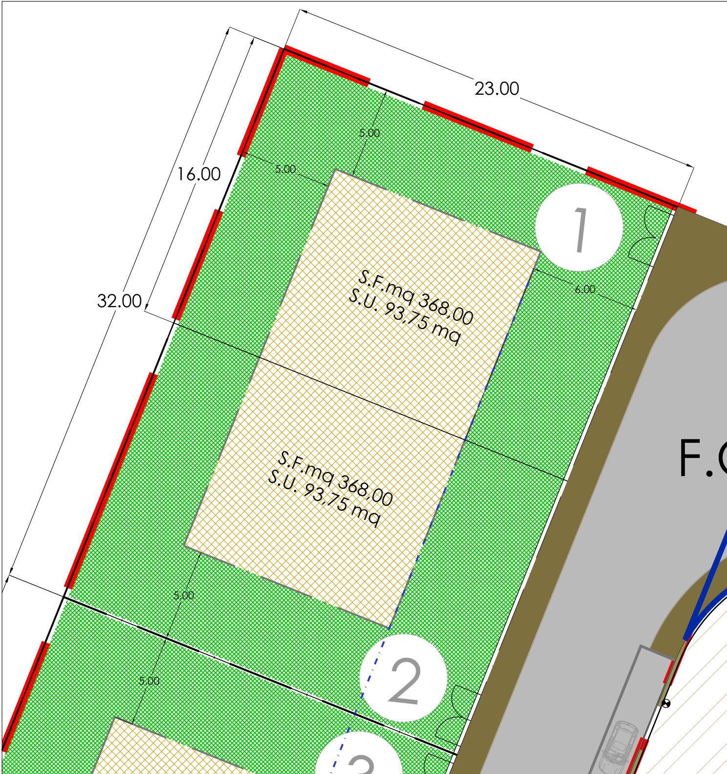
PLANIMETRIA LOTTI 1-2